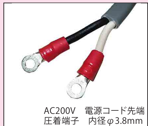
AC200V 電源コード先端 圧着端子 内径φ3.8mm